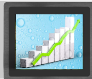
FEI9HB Réf. 3464